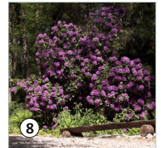
8 Rododendrón v čase kvitnutia