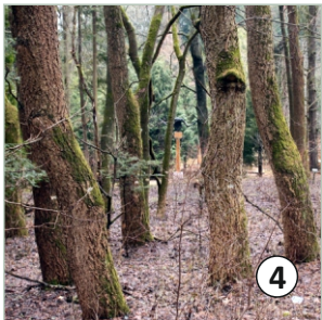
4 Korkovník amurský ( P. amurense )