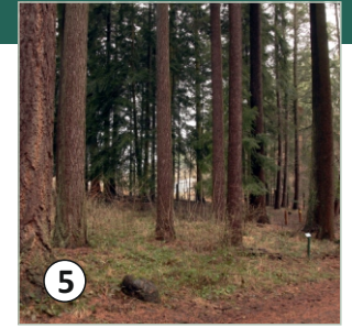
5 Douglaska tisolistá ( P. menziesii )