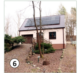
6 Prevádzkovo-administratívna budova