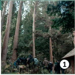
1 Sekvojovec mamutí ( S. giganteum )