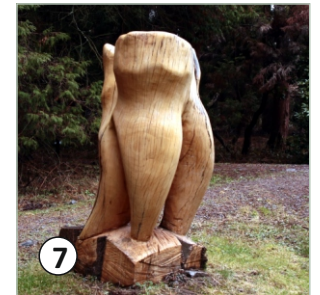
7 Socha vytvorená v rámci workshopu vizuálneho umenia „Vnoobjekt“