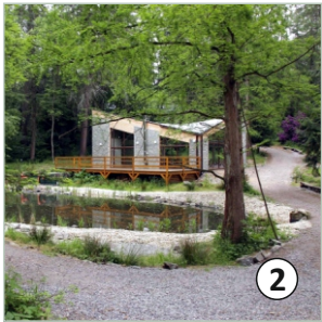
2 Obnovené jazierko